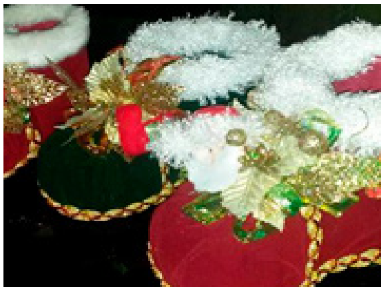
Figura 2. Bota navideña elaborada con botellas plásticas, por estudiantes de primaria de la IED Algarrobo.

El grupo de investigación Roedores de un ambiente Idealista se encargó de liderar las actividades planteadas, con el acompañamiento del docente de ciencias naturales. En cuanto a la realización de manualidades, a base de material reciclable, fueron elaborados artículos navideños y alcancías; entre otros (Fig:2).