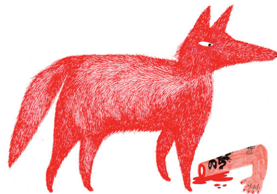
6. Ibíd. , 218.

Estos resortes subjetivos se tocan, desde luego, en el marco de un discurso que contempla un plus de goce en juego. Como se sabe, la propaganda anticomunista fue orquestada por los Estados Unidos, en razón de los fuertes intereses económicos que tenían en la región. Hay dos pinceladas al respecto presentadas en el documental: la primera es un reportaje, que probablemente data del año 1966, en el que el periodista Teddy Yates, informando para NBC, presenta una versión de los acontecimientos ocurridos según la cual se había obtenido la victoria mundial más contundente sobre el comunismo, que dejaba a la isla de Bali, más hermosa que nunca, libre de comunistas, i quienes habrían pedido ellos mismos que los ejecutaran! A lo que enseguida agrega un breve comentario sobre el enorme potencial de recursos naturales con que cuenta Indonesia y el ejemplo logrado que constituye el imperio del caucho que Goodyear tiene en Sumatra. Baste recordar que los miembros del sindicato de los trabajadores del caucho eran comunistas y que ellos fueron hostigados, encarcelados y asesinados, pues, como se dice, había “intereses superiores”. La otra pincelada que entrega el documental es esa suerte de humorada cínica que suelta un líder del comando Aksi cuando reclama el premio que debía otorgarle los Estados Unidos, que podría ser un viaje en avión o al menos un crucero, pues ellos no habían hecho otra cosa que seguir sus enseñanzas de odiar a los comunistas.