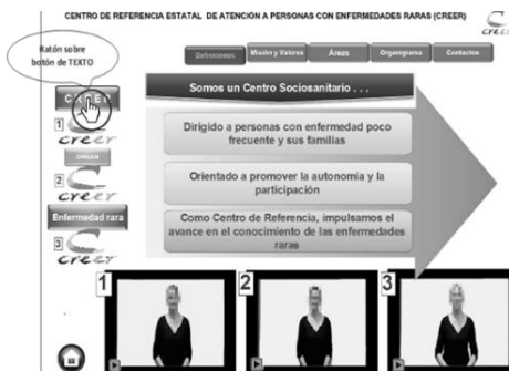
Figura 2. Si no hay problemas de lectura se clicca este botón con la definición en texto