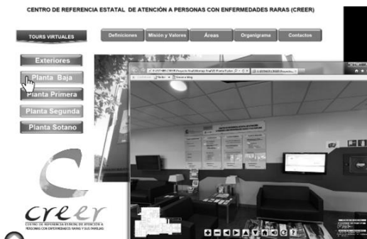
Figura 1. Navegación sobre pantalla de menú principal (tour virtual por el Hall)

Las figuras 1, 2 y 3 muestran ejemplos de materiales elaborados que incluyen una buena representación de los recursos trabajados con las distintas herramientas.