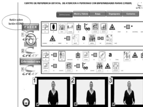
Figura 3. Si hay audiencia que lo requiere, se sitúa el ratón en el botón-ícono para ver la definición en pictogramas, o se visualiza el vídeo correspondiente con lengua de signos y audio

Como valoración de la satisfacción y efectividad de este trabajo colaborativo hemos atendido a las respuestas a las encuestas docentes que la Universidad de Burgos realiza cada curso dentro de su plan de Evaluación Docente para su profesorado. En estas encuestas se pregunta a los estudiantes, a final de curso, pero antes de la realización de los exámenes para evitar respuestas sesgadas por los resultados en los mismos acerca de su satisfacción con el desarrollo de la asignatura y la labor de cada profesor.