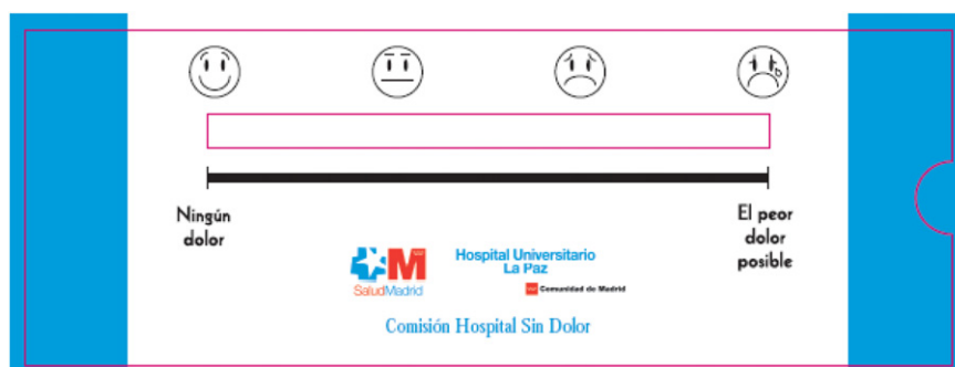
Figura 1 Escala de medición del dolor.