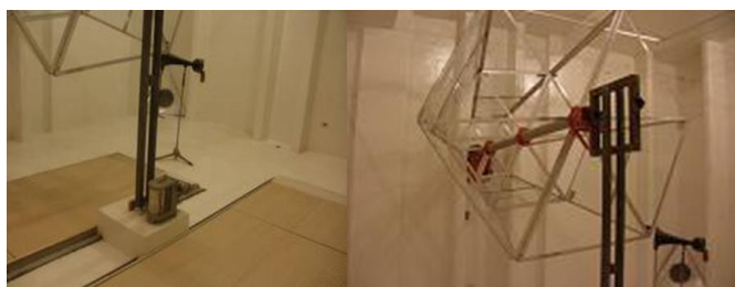
Figura 4. Vista interna e instrumental de la cámara de reverberación.