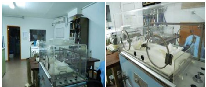
Figura 2. Instrumental del Laboratorio del Ferreyra en 2013.