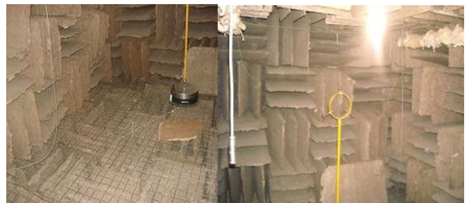
Figura 3. Vista del interior de la Cámara Anecoica.