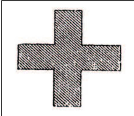
Figura 1. Cruz Roja (Binet y Féré, 1885b, p. 391).