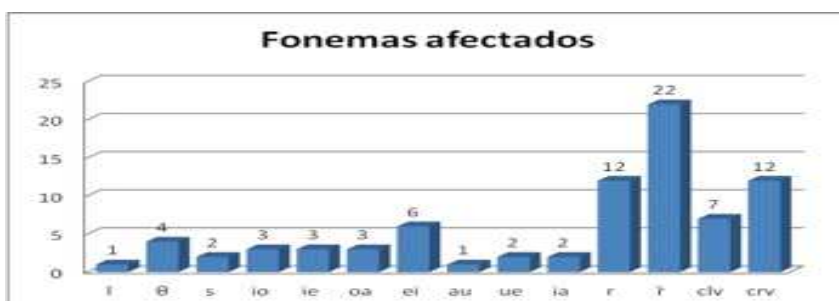
Figura 2. Identificación de fonemas afectados en el GC (pre-)

Asimismo, como se observa en la Figura 2, los niños del grupo control (GC), antes de implementarse el programa, cometieron los siguientes errores de articulación: 1 niño (4%) en el fonema /l/ y en el diptongo au; 2 niños (8%) en el fonema /s/ y en los diptongos ue e ia; 3 niños (12%) en los diptongos io, ie y oa; 4 niños (16%) en el fonema /θ/; 6 niños (24%) en el diptongo ei; 7 niños (28%) en los sinfonos CLV; 12 niños (48%) en el fonema /r/ y en los sinfonos CRV; y 22 niños (88%) en el fonema /r̄/.