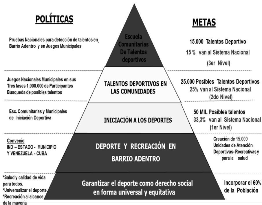
Figura 2. Ministerio del Poder Popular para el Deporte (MPPD, 2006)

Por otro lado, en el Plan Nacional de Deporte, Actividad Física y Educación Física 2013-2025 (2012), se enfoca, la directriz central de Venezuela como Potencia Deportiva del Siglo XXI basándose para ello en la masificación de la Educación Física, la Actividad Física y el Deporte en beneficio de toda la población y la Tecnificación del Deporte de Alto Rendimiento. Con (Ley Orgánica de Deporte, Actividad Física y Educación Física, 2011) se inicia un proceso de transformación en la promoción, organización y administración del deporte y la actividad física como servicios públicos, reconociéndolos como derecho fundamental de los ciudadanos y ciudadanas y como un deber social de Estado.