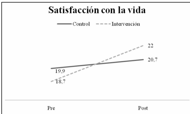
Gráfico 1. Representación gráfica del efecto del programa antes y después en relación a la variable satisfacción con la vida (SWLS).

De acuerdo con la Tabla 4 el ANOVA (grupo x tiempo) para la variable autoeficacia generalizada mostro un efecto principal significativo del tiempo F(1,48) = 32.320 ; p < .001 . El eta cuadrado parcial fue de .40, que significa